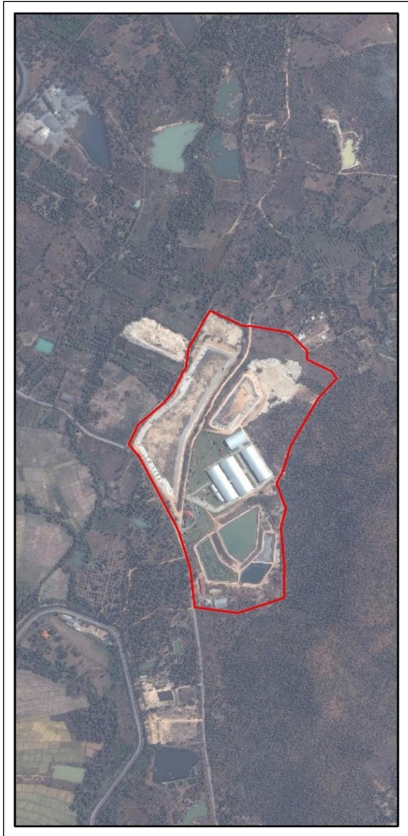
ตัวอย่างแผนที่แสดงที่ตั้งระบบและการใช้ประโยชน์ที่ดินในรัศมี 1 กิโลเมตร